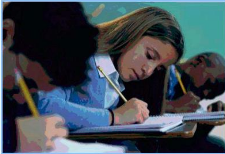
Figura 9. Momento de la aplicación de la preprueba en el grupo de control.

Una figura puede ser un diagrama, gráfica, fotografía, dibujo u otro tipo de representación.